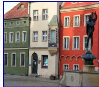
Siedziba TMMP, Stary Rynek Poznań

W sąsiadującej od południa z domkami budniczymi Kamienicze nr 10 na Starym Rynku poznańskim, wzniesionej w 1538 roku z przeznaczeniem na pomieszczenie miejskiej kancelarii, ma swą siedzibę Towarzystwo Miłośników Miasta Poznania - najstarsze towarzystwo kulturalne działające w Poznaniu. Inicjatorem powstałego dnia 14 grudnia 1922 roku Towarzystwa, jako "społecznego forum wspierania miejskich inicjatyw dotyczących estetycznego, higienicznego i kulturalnego poziomu miasta" był Cyryl Ratajski - Patron Towarzystwa - w latach 1922 - 1934 oraz we wrześniu roku 1939 - Prezydent Stołecznego Miasta Poznania.