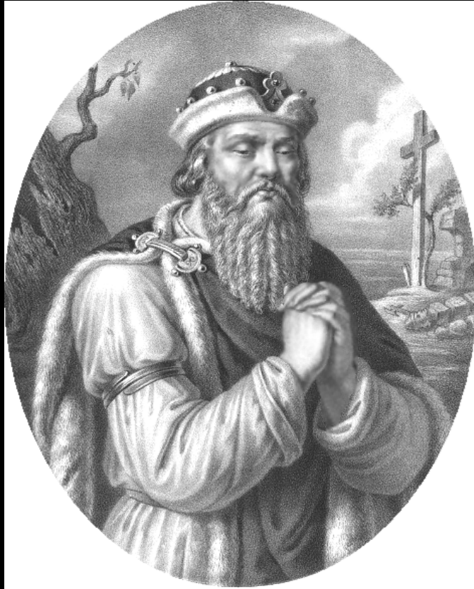
6. Mieszko I, grafika Aleksandra Lessera