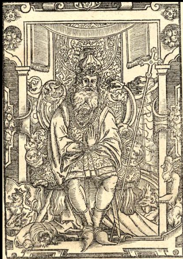
2. Mieszko I, ilustracja z dzieła ks. Jana Gluchowskiego, Icones ksiąząt i królów polskich, 1605