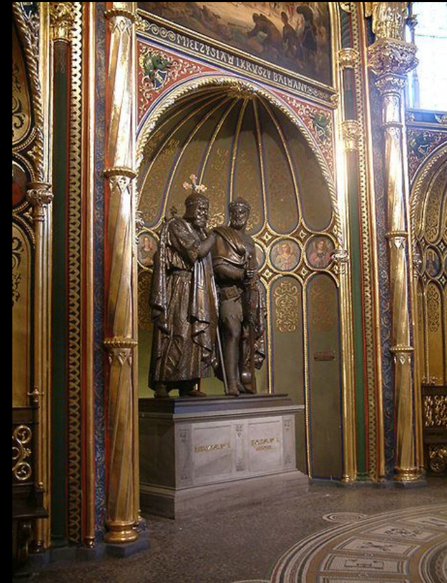
7. Złota Kaplica w Poznaniu – posąg Mieszka I i Bolesława Chrobrego