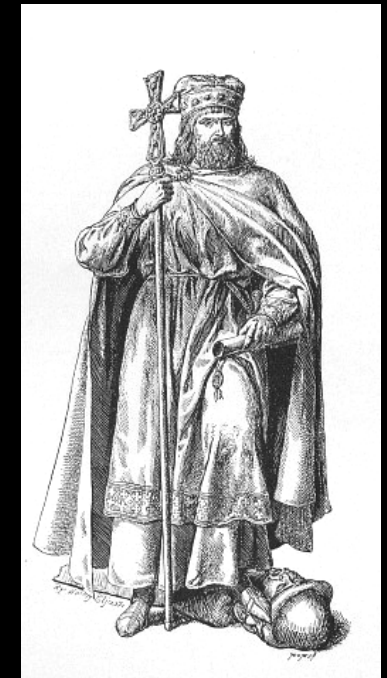
5. Mieszko I na rycinie Walerego Eljasza-Radzikowskiego z XIX wieku