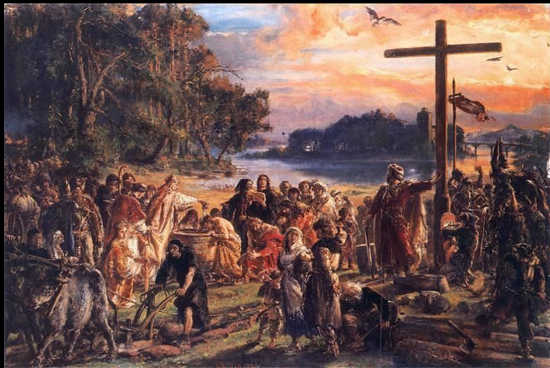
3. Jan Matejko, Zaprowadzenie chrześcijaństwa