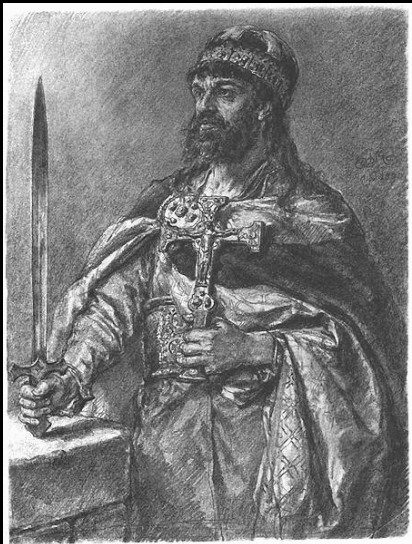
1. Mieszko I